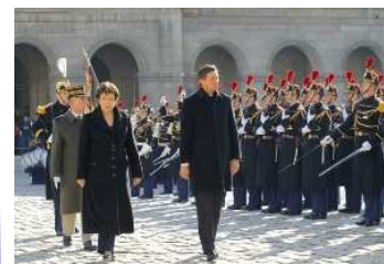
Premier ministre Pahor et la ministre Bachelot-Narquin devant l'Hôtel des Invalides.

»J'aimerais dire à quel point cette signature du partenariat avec la Slovénie est importante pour la France.«