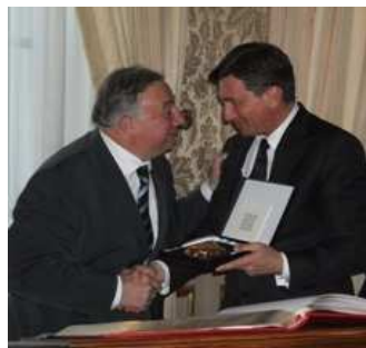
Au président du Sénat, M Larcher, vétérinaire émérite, M pahor a offert un cheval de Plečnik konja (ci-dessus), et au directeur général de l'OIF un fauteuil de Plečnikov (ci-dessous).

Par la suite, M Pahor a rencontré M Gérard Larcher, Président du Sénat. L'entretien portait sur les relations bilatérales, le partenariat stratégique signé la veille et l'élargissement de l'UE.