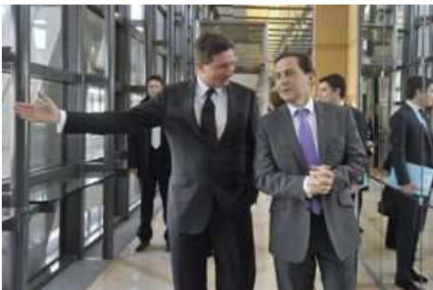
Premier ministre Borut Pahor avec le ministre Eric Besson

Comme pour illustrer son propos, le géant français GDF Suez a procédé à la signature d'un contrat avec l'entreprise slovène Bisol.