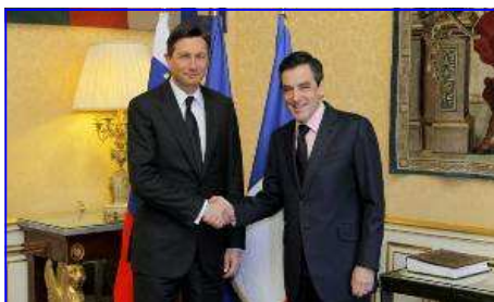
Les Premiers ministres Pahor et Fillon.

Le deuxième jour de la visite, le Premier ministre slovène a rencontré son homologue français M François Fillon. Ils ont échangé principalement sur les questions économiques et les possibilités d'investissement. Ils ont évoqué également le pacte de compétitivité, pour lequel la prochaine réunion du Conseil sera décisive, l'élargissement de l'UE et les Balkans occidentaux. Le Premier ministre français a félicité son collègue slovène pour le vingtième anniversaire de la Slovénie indépendante, une réussite et un modèle pour ses voisins des Balkans et de l'Europe de l'Est.