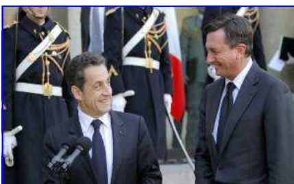
Premier ministre Pahor et le Président de la république Sarkozy au Palais de l'Élysée