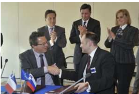
Signature de contrat entre Bisol et GDF Suez.

Par la suite, M Pahor a rencontré M Gérard Larcher, Président du Sénat. L'entretien portait sur les relations bilatérales, le partenariat stratégique signé la veille et l'élargissement de l'UE.