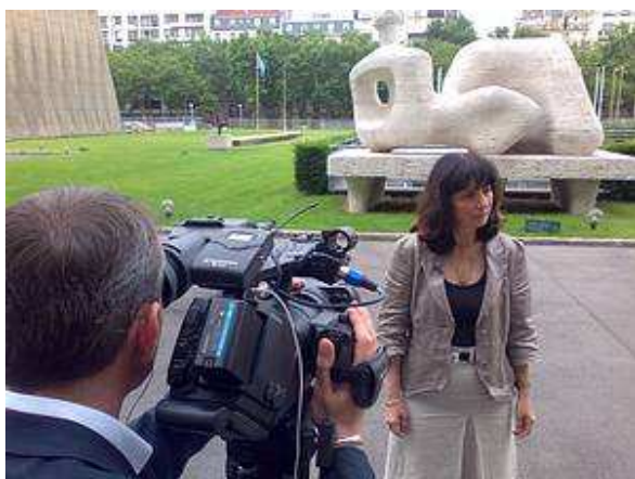
Déclaration de Mojca Škrinjar pour le site web de l'UNESCO

Du 20 au 22 juin 2012 s'est déroulé à l'UNESCO le World Open Educational Resources Congress, auquel participait une délégation de la Slovénie sous la houlette de Mojca Škrinjar, secrétaire d'Etat au Ministère d'Education, Science, Culture et Sport. Lors de la table ronde "Réaction de représentants gouvernementaux à la Déclaration de Paris sur les ressources d'éducation ouvertes" animée par Janis Karklinš, directeur-adjoint pour la communication et information de l'UNESCO, la secrétaire d'Etat Škrinjar a présenté les expériences et les projets de la Slovénie. Il s'avéra lors de sa présentation que les bonnes pratiques slovènes dans ce domaine peuvent intéresser au niveau international.