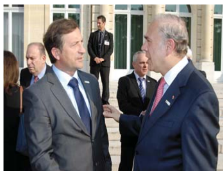
Ministre Erjavec avec le SG OCDE Angel Gurría

Karl Erjavec, le ministre slovène des affaires étrangères a participé les 23 et 24 mai à la réunion annuelle des ministres de l'OCDE à Paris. A cette occasion, il a visité l'Ambassade de Slovénie en France le 24 mai et a pris connaissance avec l'actualité politique et sociale en France.