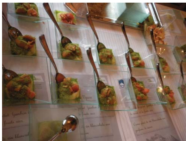
Truite fumée de Vipava

Cette méthode d'aborder le public s'avère en phase avec la communication d'une image moderne et dynamique de la Slovénie - un pays encore peu connu en France. Ce genre d'événements touristique et culinaires, concentrés sur la qualité, contribuent à faire émerger une "marque" Slovénie en France.