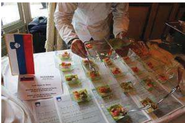
Le stand slovène

L'Association des attachés agricoles des ambassades étrangères à Paris organise chaque année une manifestation culinaire appelée la Planète du Goût. Sous le haut patronage du ministère de l'agriculture français, l'événement a eu lieu pour sa sixième édition le 22 mai dernier dans la résidence de l'ambassadeur des Etats-Unis, en présence du tout nouveau ministre de l'agriculture Stéphane Le Foll. L'idée est de présenter au public français et international - ambassadeurs, représentants des ministères, hommes d'affaires, distributeurs, journalistes et autres personna-